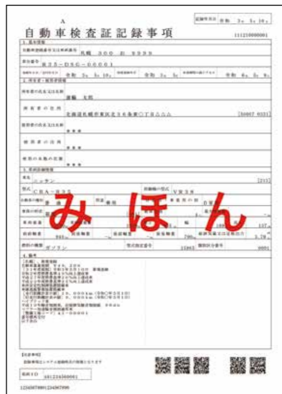
自動車検査証記録事項 見本

(注2) 自動車検査証記録事項とは、ICカード取得・更新時に発行されたものの、または車検証閲覧アプリでPDFファイルとして出力したものをいいます。