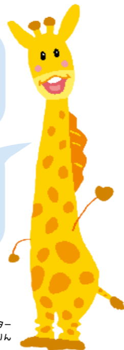
教職員共済イメージキャラクター あむりん

さらに総合共済は教職員賠償もついているので「給食の止め忘れ」「生徒から預かったスマホを壊した」などの 業務中の賠償事故も補償 ！