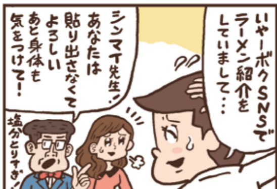
※このマンガはもちろんフクションです。