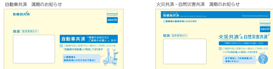
※「満期のお知らせ」はクリーム色の長3サイズです。

勤務先でのお手続き等で「共済証書」が必要になった場合は、まずはお手元の「満期のお知らせ」をご確認ください。 もし「共済証書」が見当たらない場合は、再発行いたしますので、各事業所または本部までご連絡ください。