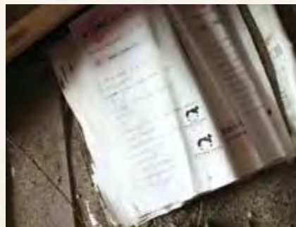
2人が暮らしていた官舎に、義母の使っていた手話の本が何冊も残っていた