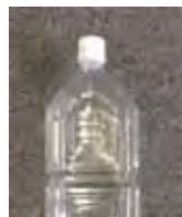
1ℓの水を ペットボトルに入れる