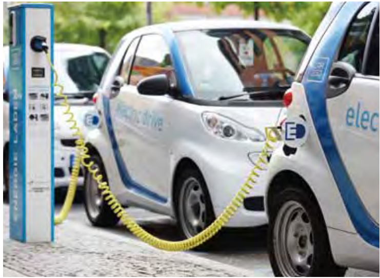
街中に縦列している「Car2Go」。フロントガラスにある認証機に会員証をかざし、暗証番号を入力するだけで使用できる。

先日、同じマンションに住む知人がクルマを手放しました。「クルマがなければ、家族で海外旅行に行けるわよ」と奥さまにいわれたことがきっかけで、クルマの維持費を見直したところ、都心の駐車場、自動車税と自動車保険をあわせて年間50万円近くかかっていたそうです。皆さんのなかにも、なんとなくクルマが必要だから所有しているという人は多いでしょう。大都市では多くの人が通勤に電車を使うこともあり、実際にクルマで走っている時間とはぐくわずかです。毎週末に大型店に買い物に行ったり、月に一度、晴れた週末に遠出するくらいなら、クルマを走らせている時間は月に10時間以下といわれています。それなのに、自動車を購入したときには自動車取得税、毎年の自動車税（または軽自動車税）、車検時に自動車重量税を払います。月々の駐車場代、車検時にまとめて払う自賠責保険、毎年更新