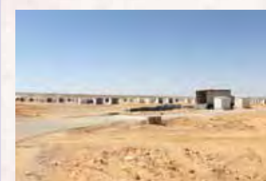
5万5000人のシリア難民を受け入れられるよう急ピッチで新設中のアズラク難民キャンプ。トイレとシャワールームは4～6世帯で共有。

から遠く離れた国かもしれないかもしれませんが、大切な人を突然失う悲しみ、キャンプで不自由な生活を強いられる苦しみが、東日本大震災と重なる部分があり、決して人ごとではありません。国連UNHCR協会のホームページでは、随時、シリア難民の状況をお伝えしています。援助物資もさることながら、悲惨な体験を通じて心理的にトラウマを抱えた人々をケアするためにも、皆さまのお力がぜひ必要です。皆さま一人ひとりのご支援が、シリアの人々を救う大きな力となります。