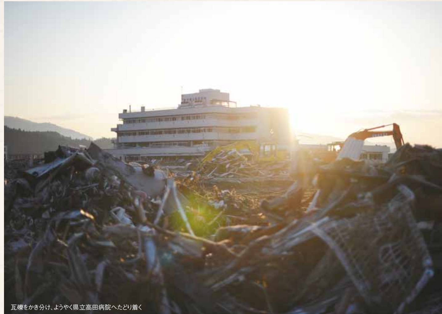
瓦礫をかき分け、ようやく県立高田病院へたどり着く