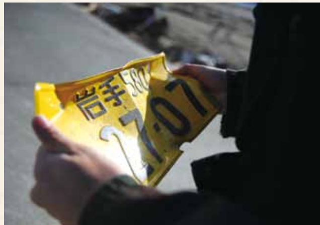
義母の使っていた車から、ナンバープレートだけを持ち帰った