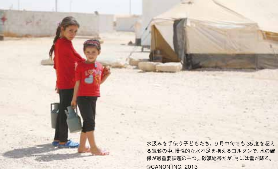
水汲みを手伝う子どもたち。9月中旬でも35度を超える気候の中、慢性的な水不足を抱えるヨルダンで、水の確保が最重要課題の一つ。砂漠地帯だが、冬には雪が降る。

「難民」というと、ただ漠然と「アフリカに多く、テントの中で援助を受けながら生活をしている人々」というイメージがあるかもしれませんが、そのイメージに必ずしも合致しない難民も同時にいることを忘れてはなりません。シリアは中東地域では生活水準の高い国で、内戦が始まる前は、家族と暮らし、職業を持ち、子どもたちは学校へ通うといった、私たちと変わらぬ生活を送ってきた人々です。そんな日常が破壊され、難民となるしかないシリアの人々の苦悩は想像を絶するものがあります。