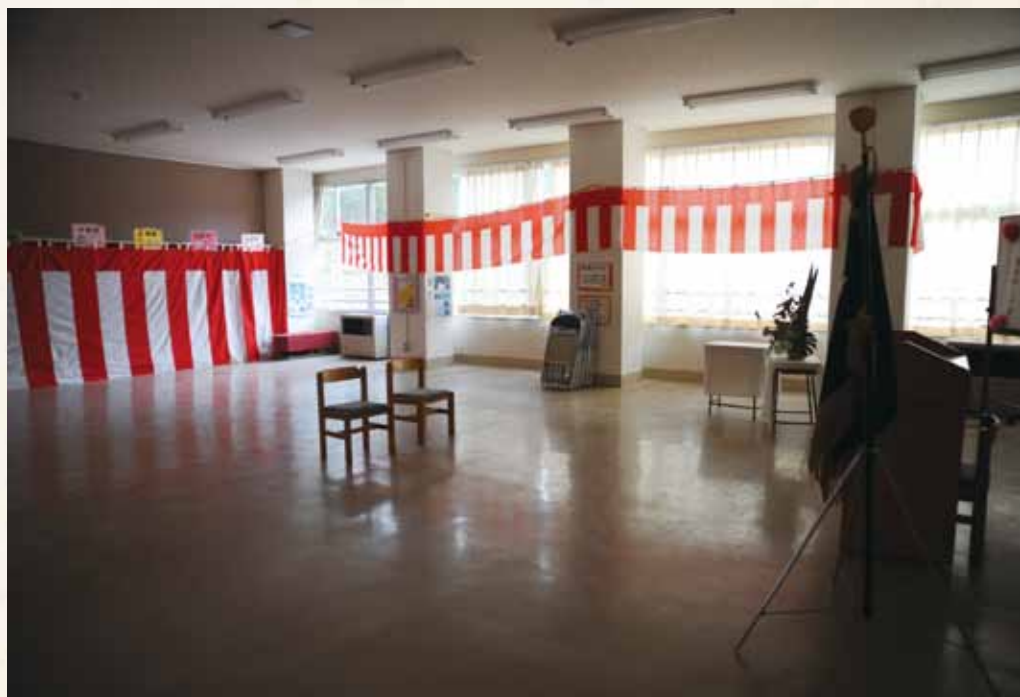
上/2011年4月。二人の入場を待つ、気仙小学校の入学式会場 左/気仙小学校前に、拾われた鯉のぼりが掲げられていた

震災発生から3年が経とうとしている。県立病院跡地も、義父母が暮らしていた官舎も解体が終わり更地となった。周囲ではすでにかさ上げ工事が始まり、高さ数メートルにもなる盛土がいくつも市街地に連なっている。高台移転のために山が切り崩され、日々風景が変わっていく。