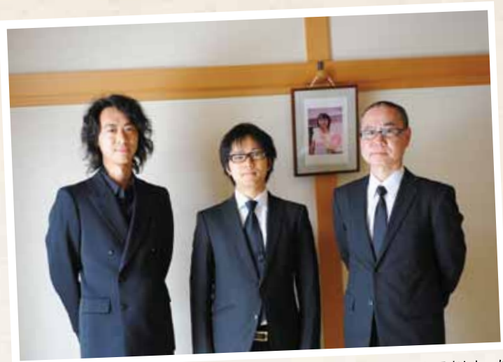
一周忌の日。一生忘れられない家族写真となった

ぽかぽかと気持ちのいい陽気の日だった。そんなどかな気候とは対照的に、外は騒々しかった。避難所となっていた長部小学校には、物資を載せたトラックやガソリンの給油車、自衛隊の車両が休みなく出入りしていた。