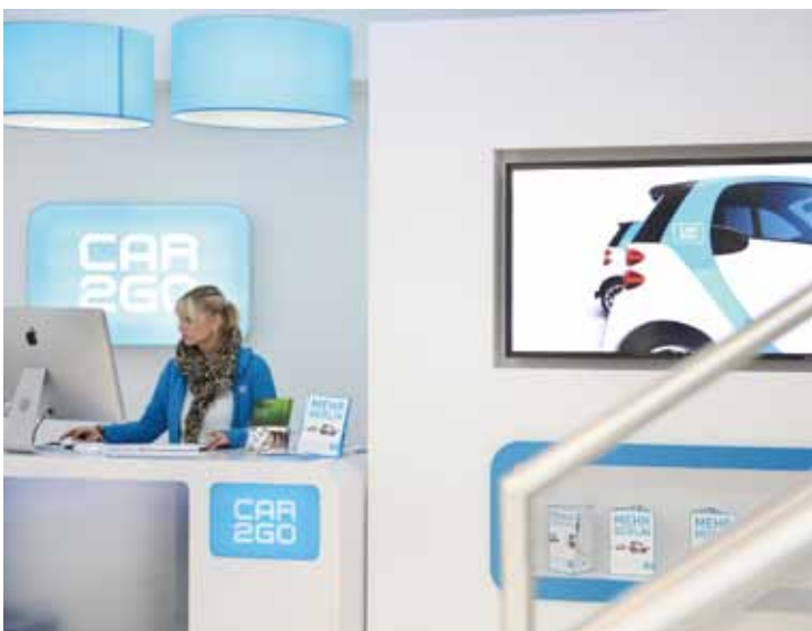
「Car2Go」の店舗。鮮やかなブルーのロゴが目を引く。

一方、カーシェアの普及は、「若者のクルマ離れ」に歯止めをかける効果があるという期待もあり、今後の展開に注目です。