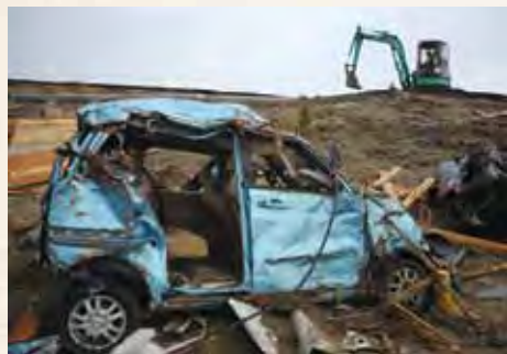
義母の使っていた車。ギアはパーキングのままだった