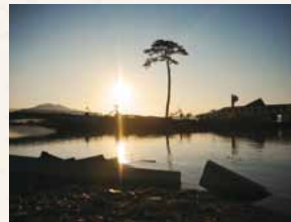
高田松原跡地に立つ、奇跡の一本松