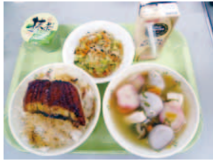
高校2年のリクエストはうな井

焼き、東京下町の深川飯、沖縄のゴーヤチャンプル、長崎の皿うどんなど、こちらもおもしろい料理がいろいろと並びます。原先生によると、今後は先生方の出身県の郷土料理巡りというのも考えているそうです。