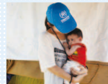
レバノンの非公式居住地にあるテント内で、シリア難民の赤ちゃんを抱く UNHCR 職員。