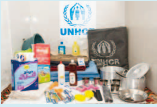
UNHCRが支給している毛布、調理器具、衛生用品などの援助物資