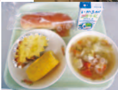
次の日の昼食に出ました