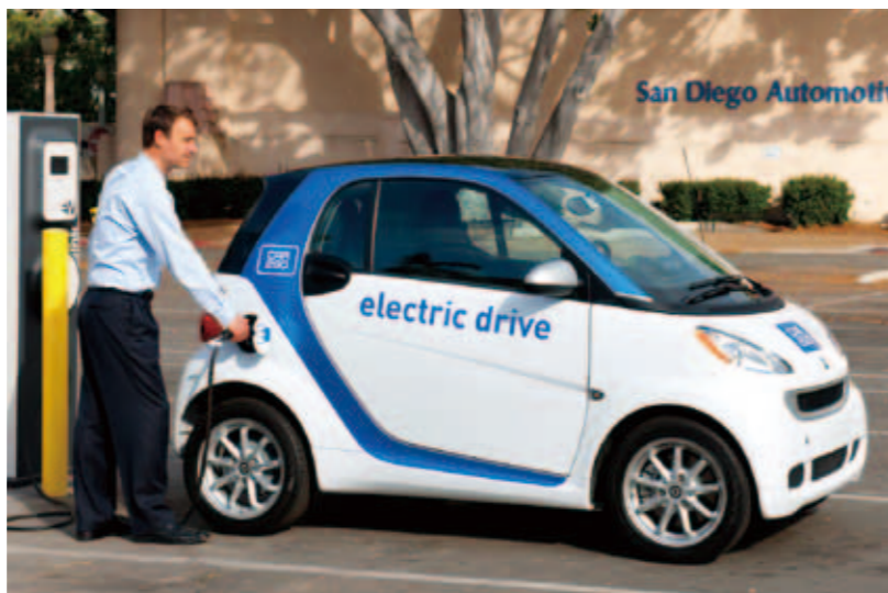
サンディエゴ自動車博物館の前には車の充電スタンドが設置され、だれもが自由に充電することができる

とはいえ、これまでどおり好き勝手にクルマを乗り回せる時代ではないことも事実です。ここでやっと、「究極のエコカーがないことがエコな社会」という考え方につながります。これまでサハラ砂漠を横断できるようなクルマに乗って近所に買い物へ行っていたわけですが、最近では、電気自動車（EV）、ハイブリッド車、プラグイン・ハイブリッド車（PHV）、クリーンディーゼル車、スタート・ストップ機構付きガソリン車など、低燃費車のバリエーションが揃ってきたことで、個人の使い方にあったエコカーが選べる時代になってきています。通勤や日常の買い物にクルマを使う人にはEV、週末の遠出が多い人にはクリーンディーゼル車、長距離を走る人には低燃費ガソリン車