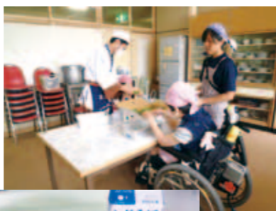
うまくむけるかな