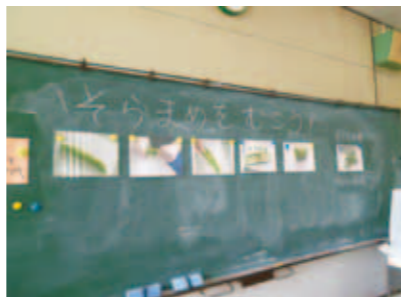
とうもろこしの皮むき