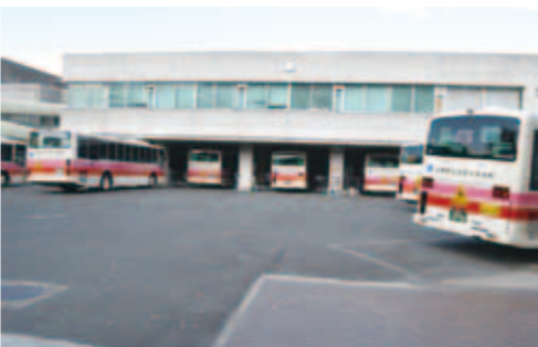
バス内部は生徒が乗りやすいように改造されている

校門から広々とした緩やかな坂道を下ると、交野支援学校の校舎が見えてきます。まず目についたのは、校舎の1階部分がまるでバスの車庫のようになっていること。後ろ向きで停車したバスがズラリと並んでいます。かなり遠方から通学する児童生徒が多いのと、身体にさまざまな障がいがあり、車イスを使う子どもたちも多いため、バス通学が基本となっているとのことでした。