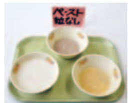
同じ献立のペースト食