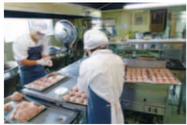
相当な数のハンバーグも、すべて手作り

すること。つまり、食事の形状です。嚥下や咀嚼が困難な児童生徒のために、給食は5段階(普通食・柔らか煮・カッター食・ペースト粒あり・ペースト粒なし)で調理されています。