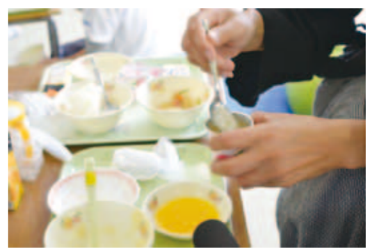
先生と生徒の食事が並ぶ。食べやすいようにゼリーもとりみつ

す。ペースト状では、どんな色や形のものだったのかわからないですからね」「いわゆる三角食べはさせません。次々に味が変わると、子どもは何を食べているのかわからなくなり、混乱してしまいます。これでは楽しい食事とは言えませんから」「僕たち、つまり僕とこの子は、同じ釜の飯を食う仲、生きていくための絆で結ばれているんですよ」と愛情を込めて語ります。