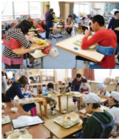
食事のマナーや食べ方も覚えながら(高等部1年)

しみであり、また生きていくためにも必要なことなのです。だからこそ、しょっちゅう話しかけて、笑い声が出るくらい楽しい食事の時間にしたいのです」「見てのとおり、僕はこの子の横で普通食の給食と一緒に食べます。僕が味噌汁をすすったら、今日の味噌汁はうまいぞ!って話しかけて、この子にもペーストの味噌汁をスプーンで口に運びます。ごはんやおかずもそんな風にして食べさせます」と話します。